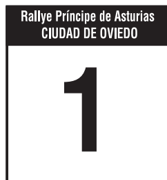
A (50 x 52 cm.)